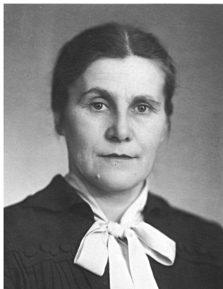
110 лет со дня рождения Ф. Н. Квашиной