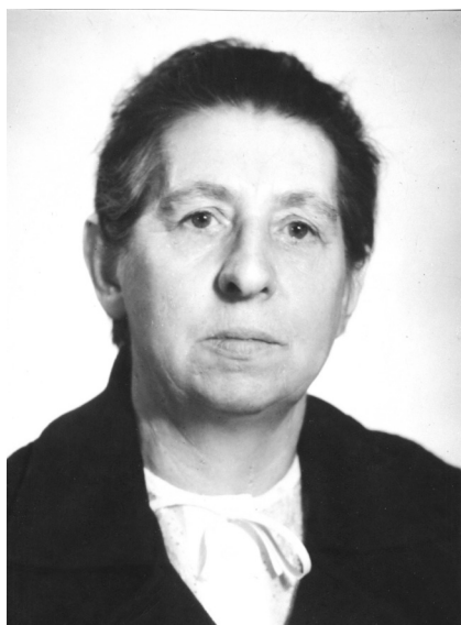
110 лет со дня рождения Т. Э. Вогулкиной