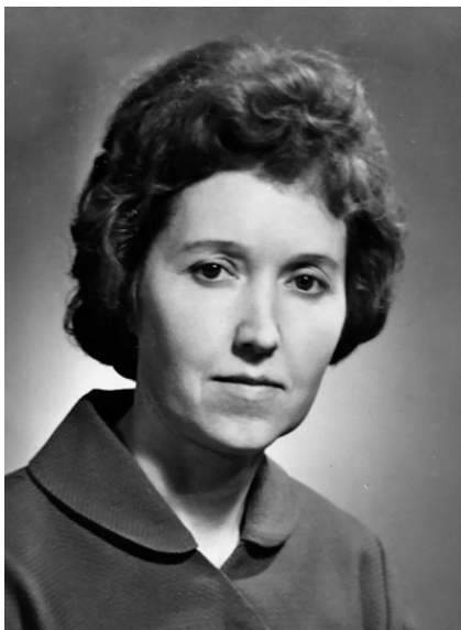
100 лет со дня рождения В. В. Малышевой