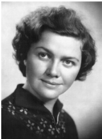
100 лет со дня рождения Б. Я. Булатовской