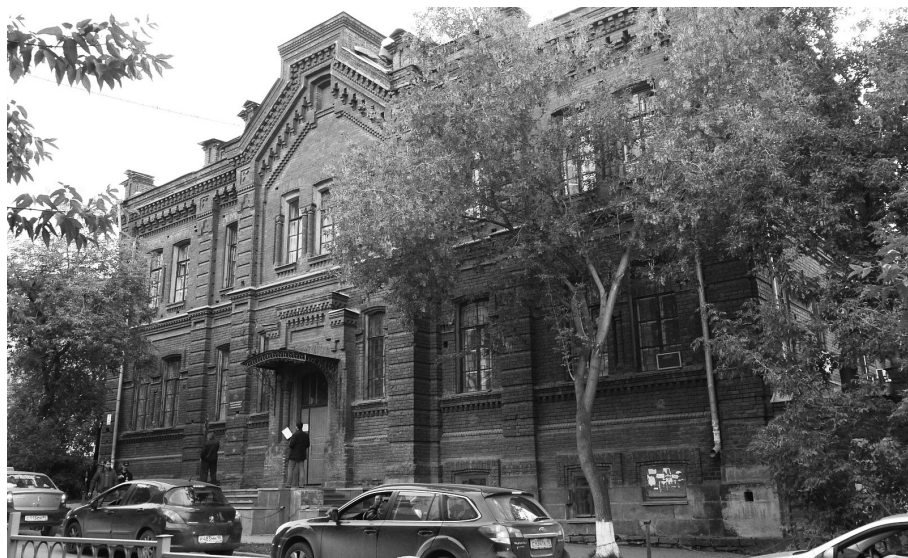
5 лет назад в Екатеринбурге по адресу ул. Крылова, 2 в здании бывшего Верх-Исетского сиротско-воспитательного дома С. А. Петрова открыт Дом добровольцев