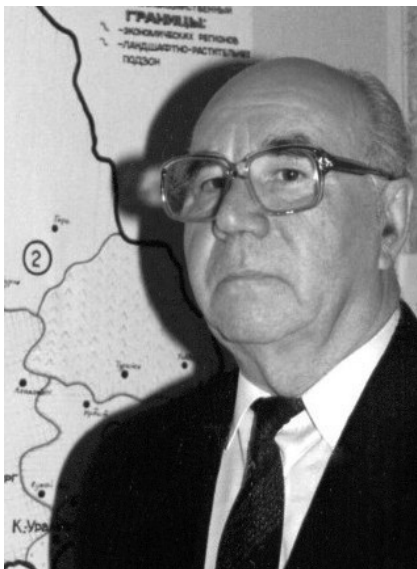
100 лет со дня рождения Д. Н. Пономарева